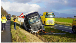
112 Vrachtwagen voorkomt zwaar ongeluk op N247 en belandt in greppel