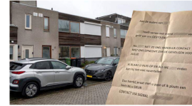
Explosie Bewoonster wordt slachtoffer van explosie aan verkeerd adres in Hoorn: 'Ik heb hier niks mee te maken'