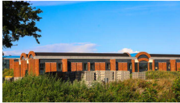
Woningbouw Ruim een kwart van de huurwoningen in het voormalige Scheringa Museum wordt bewoond door Opmeeders