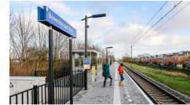
Mobiliteit Welkom, op de meest nutteloze stations van Noord-Holland! Er stappen nauwelijks reizigers in en uit...