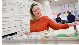
Reportage Staking bij de apotheken, dus snel medicijnen halen. 'We hebben het drukker dan anders'