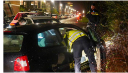
Stopteekenegeerd Vluchtende bestuurder aangehouden na dollemansrit door woonwijk in Hoorn