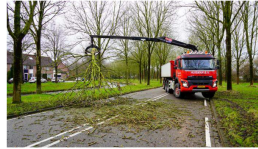
112 Boom omgevallen op IJsselweg in Hoorn, vrachtwagenchauffeur schiet te hulp