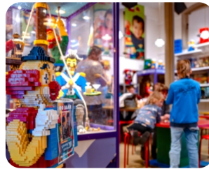
Jubileumjaar Museum van de 20e Eeuw in Hoorn zeer geslaagd