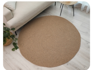
Zó lang gaat een vloerkleed mee: de levensduur van elk type vloerkleed