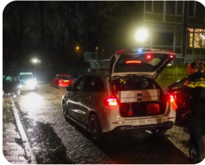
Automobilist rijdt met hoge snelheid door woonwijk in Hoorn tijdens politie-achtervolging