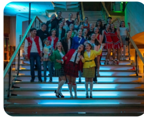
Westend Junior breidt uit naar Westend Junior en Young Westend