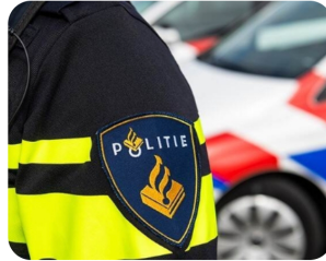
Politie zoekt getuigen en camerabeelden explosie Groene Steen in Hoorn