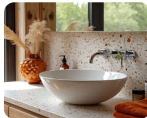
Ontdek hoe mooi terrazzo in jouw interieur kan staan