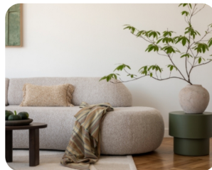
Huurwoning inrichten? Met deze tips maak je jouw huurwoning