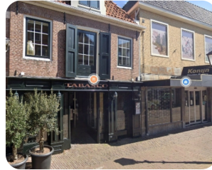
Inbraak bij restaurant Tabasco in Hoorn