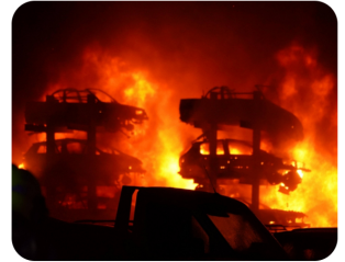
Grote brand bij demontagebedrijf in Blokker: zo'n 15 auto's afgebrand